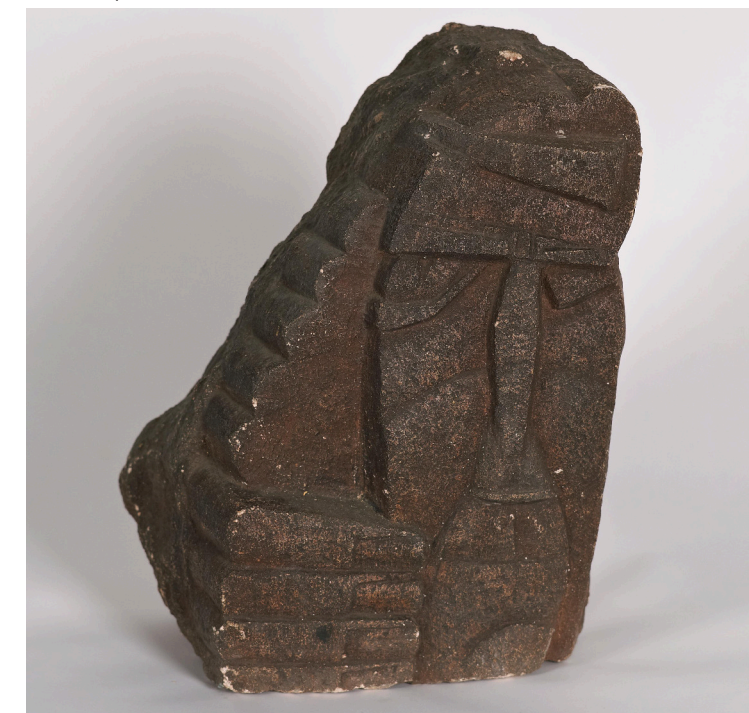
584 - Oscar De Clerck - Sans titre - 40 x 28 x 20 cm : 60.000 euros.

► A modern Century. Belgian Art , Galerie Maurice Verbaet Knokke, jusqu'au 7 janvier 2018, de 14 à 18h les week-ends et jours fériés, 743 Zeedijk, 8300 Knokke-Zoute. www.verbaet.com