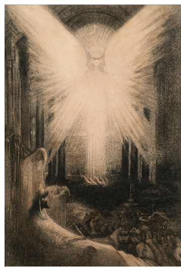
84 - Jean Delville - L'ange des splendeurs, 79 x 54 cm : 100.000 euros.

C'est à Knokke que le couple anversois a choisi d'établir sa galerie d'art dédiée à l'art moderne belge. Aux cimaises, des œuvres de grande qualité signées Spilliaert, Wouters, Leblanc, Delville, Mortier, Schmalzigaug, Delahaut, Mendelson et Guiette