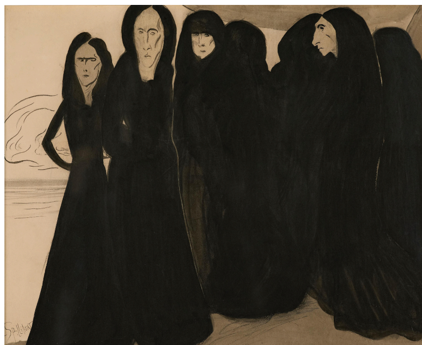
312 - Leon Spilliaert - Nature morte à la plante, 36 x 24,50 cm : 175.000 euros.

mettre sur le marché une partie de ses innombrables trésors fin-de-siècle. Deux expositions-ventes ont ainsi eu au Sablon, « sans l'effervescence et la précipitation liées aux ventes aux enchères », expliquait alors le marchand. Verbaet a depuis lors décidé de s'occuper lui-même d'écouler (une partie de) son extraordinaire butin artistique en ouvrant cette galerie marchande à Knokke, consacrée aux grands (mais pas seulement) noms de l'art moderne belge depuis le tournant 1900. Une nouvelle étape dans la vie de cet ancien agent de change reconverti dans l'art avec gloutonnerie – un trait de personnalité qu'il assume et revendique dans tous les domaines !