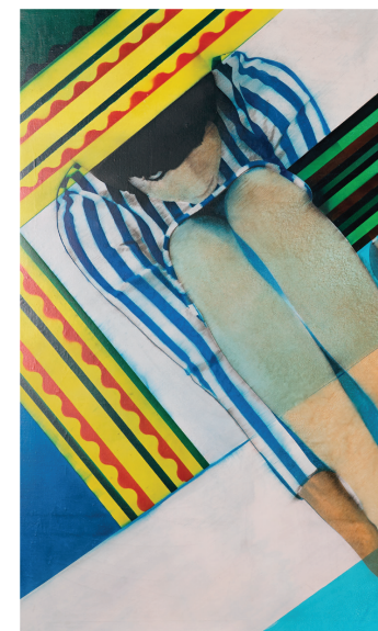
Pol Mara, Color-sum , 1967, olie op doek

'We zoeken raakpunten die ons ertoe aanzetten om verder te kijken dan het werk en een onverwachte geschiedenis te ontdekken'