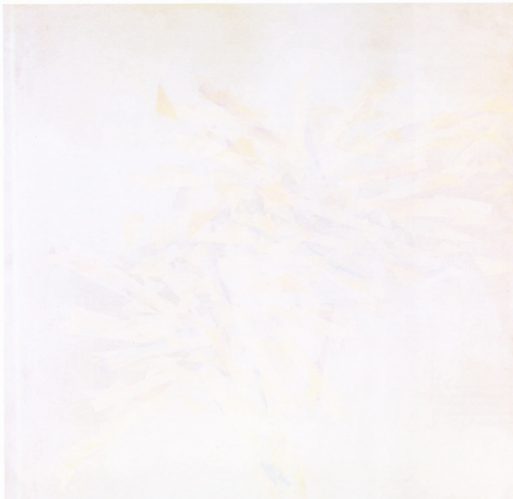
Paul Van Hoeydonck, Lichtwerk , (1961), synthetische lakverf op masoniet, 120 x 120 cm, KMSKA, inv.nr. 3318