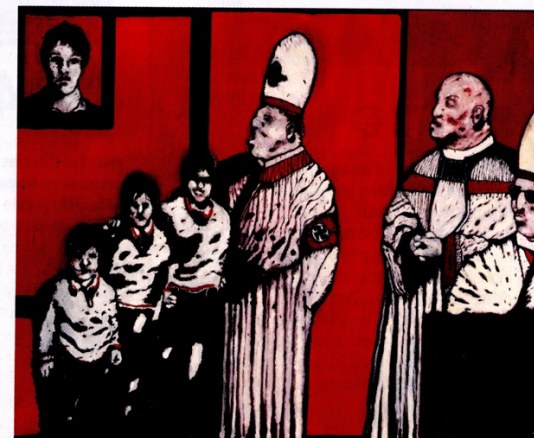
(1) Mouvement pictural d'après-guerre rassemblant essentiellement des artistes originaires d'Amsterdam, Bruxelles et Copenhague.

n'a exploré qu'une part infime de la collection. Mais que va-t-elle devenir sachant que son fondateur a déjà pris ses dispositions. « Je compte, dans les cinq ans, passer la main à un directeur fiable, afin que la gestion de la fondation ne soit pas une charge pour mes enfants, qui ont pris d'autres voies professionnelles. »