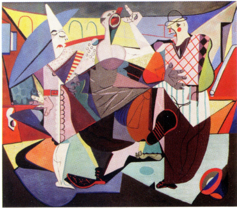
De Clowns, 1939, olieverf op doek, collectie Vlaamse Gemeenschap