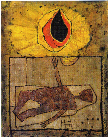
Le Soleil et l'homme, 1949, olieverf en zand op doek, Bernard Verbaet, Genève