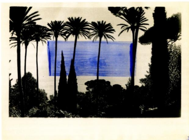
Bruno V. Roels. His Control Stops With The Shore. 2024, lino ink on a gelatin silver print, 15.7 x 19.7 in. (40 x 50 cm.) Unique.

Gallery Fifty One (Antwerp). © Bruno V. Roels/Courtesy Gallery Fifty One.