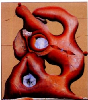
Denie Pat. Den Teerling.

2024, acrylic and oil paint on canvas, 63 x 70.9 in. (160 x 180 cm.)