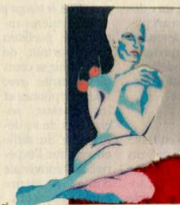
Evelyn Axell "Portrait of the lady with blue eyes", 1970; fourrure, plâtre & émaille, 106 x 66 cm. Une peinture de l'artiste namuroise exposée en la Maurice Verbaet Gallery à Knokke.

Elles sont toutes alignées sur le même "Trottoir" face à la mer. D'autres, voisins, ont anticipé l'ouverture ou ont opté pour le vernissage le 8 août. Soit un parcours Knokke-Le-Zoute à partir du numéro 720 où Samuel Vanhoegaerden après son retentissant succès à la Brafra mise sur James Ensor avec un ensemble vraiment exceptionnel de la totalité des 32 dessins couleur, jamais montrés depuis 1929, des Scènes de la vie du Christ . Des œuvres réalisées au cours des années 1912-1913. Un ensemble qui devrait idéalement rejoindre un musée de chez nous! Au bout de l'itinéraire, au 746, la J&O Saverys Gallery accumule les confettis.