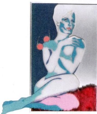
Evelyne Axell bij Maurice Verbaet.