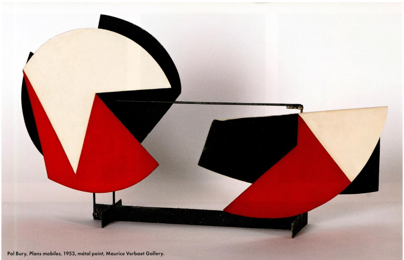
Pol Bury, Plans mobiles , 1953, métal peint, Maurice Verbaet Gallery.

les galeries Bérés, Hélène Bailly, Alexis Bordès, Brame & Lorenceau, Jean-François Cazeau, Florence De Voldère ou Éric Pouillot, pour n'en nommer que quelques-unes. La foire connaîtra aussi des éditions à Londres, Genève, Amsterdam, Barcelone, Milan, Francfort, même Moscou et San Francisco! Ainsi, en ce mois de janvier, il n'y aura pas une seule Brafa, mais une multitude de petites Brafa décentralisées! En complément de ces événements, chaque participant est invité à produire une courte vidéo personnalisée de son exposition. Toutes ces vidéos seront largement utilisées pour la promotion de l'événement. On les retrouvera sur le site web de la Brafa, avec les photos et les descriptifs des œuvres phares présentées dans les galeries, ce qui permettra également une découverte "virtuelle" des expositions et des objets pour ceux et celles qui ne pourront se déplacer.