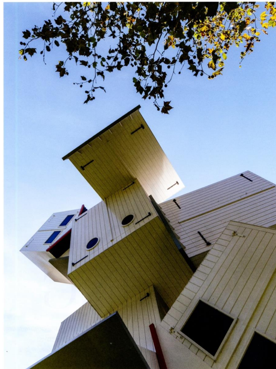
"Beach Castle" door Jean-François Fourtou.

De beste fotojournalistiek van 2020 zien we in Belgische première tijdens de World Press Photo. In de tuin van Scharpoord kan je tussen 17 juli en 15 augustus kwaliteitsfotografie van over de hele wereld bewonderen. De meest aangrijpende beelden bieden een moment van reflectie over een beklijvend jaar.