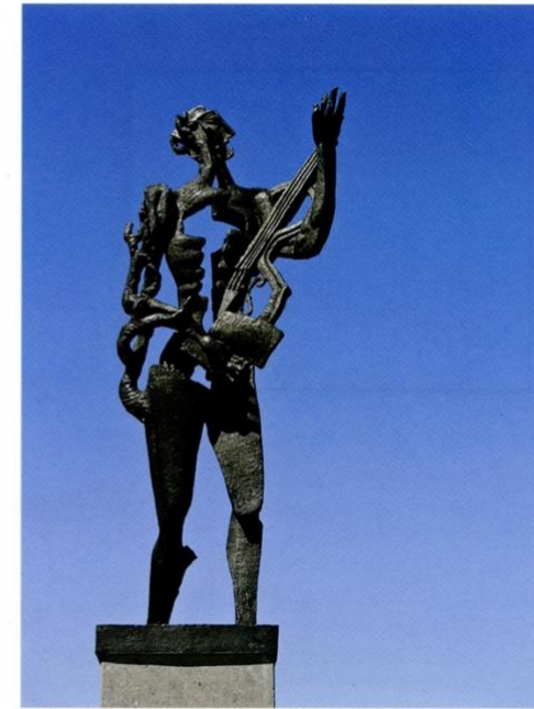
"De Dichter" door Ossip Zadkine.

MAURICE VERBAET GALLERY focust in het hoogseizoen op een designer van wereldniveau: Axel Enthoven. De ontwerpen van de Antwerpenaar zijn gekend onder een breed publiek, denk maar aan de Belgische treinen of de trams van Brussel. Maar hij maakte ook naam met strakke, geometrische en elegante stoelen met vloeiende lijnen. Met de subtentoonstelling 'Design is no Art' toont Verbaet Gallery de fijne grens tussen design en kunst aan de hand van originele ontwerptekeningen en stoelen. De Enthovendesigns staan uitgesteld naast de aanwezige werken in de galerie van 31 juli tot 12 september 2021.